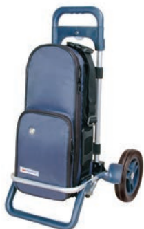
Chariot - 14090631

GCE S.A.S. 70 Rue du Puits Charles, BP N° 40110, 58403 La Charité sur Loire, France Téléphone : +33 (0)3 86 69 46 00 www.gcegroup.com