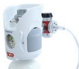
L'Elite est relié à une bouteille avec détendeur intégré